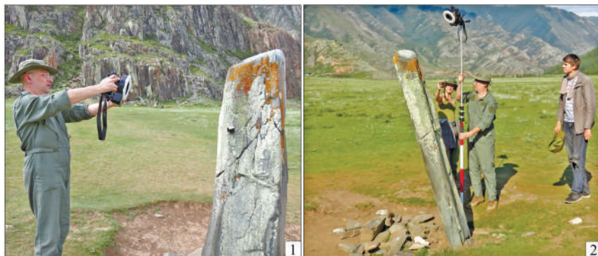
Рис. 2. Чуйский «оленный» камень. Процесс фотограмметрии изваяния, июль 2020 г.