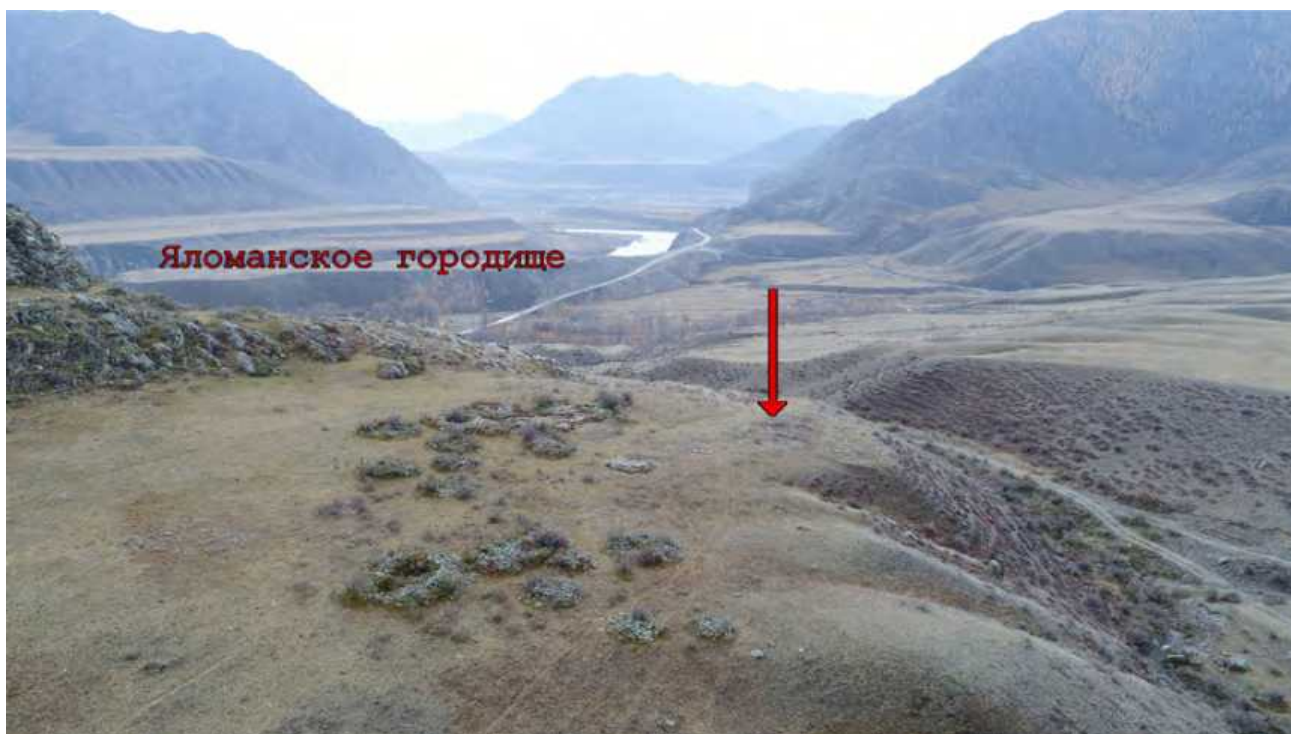
Рис. 1. Вид на археологический комплекс Яломан-II, Яломанское городище и долину Катуня