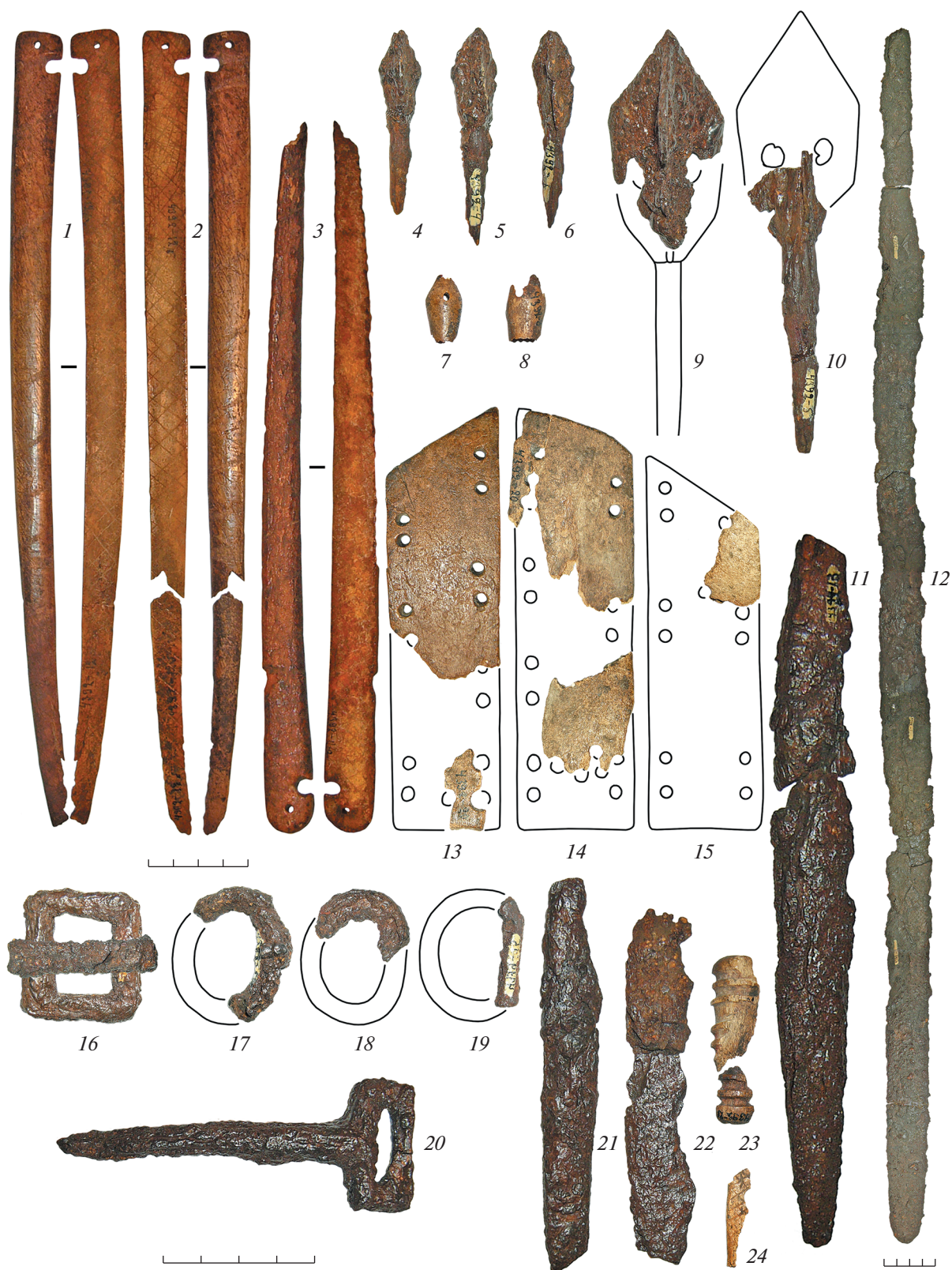
Рис. 3. Инвентарь из впускного захоронения в кургане 1 могильника Кокса. 1–3 – накладки лука; 4–6, 9, 10 – наконечники стрел; 7, 8 – свистунки; 11, 21, 22 – ножи; 12 – меч; 13–15 – панцирные пластины; 16 – пряжка; 17–19 – кольца-распределители; 20 – пряжка-крюк; 23 – трубка; 24 – неопределимое изделие. 1–3, 7, 8, 23, 24 – кость; 4–6, 9–12, 16–22 – железо; 13–15 – рог.