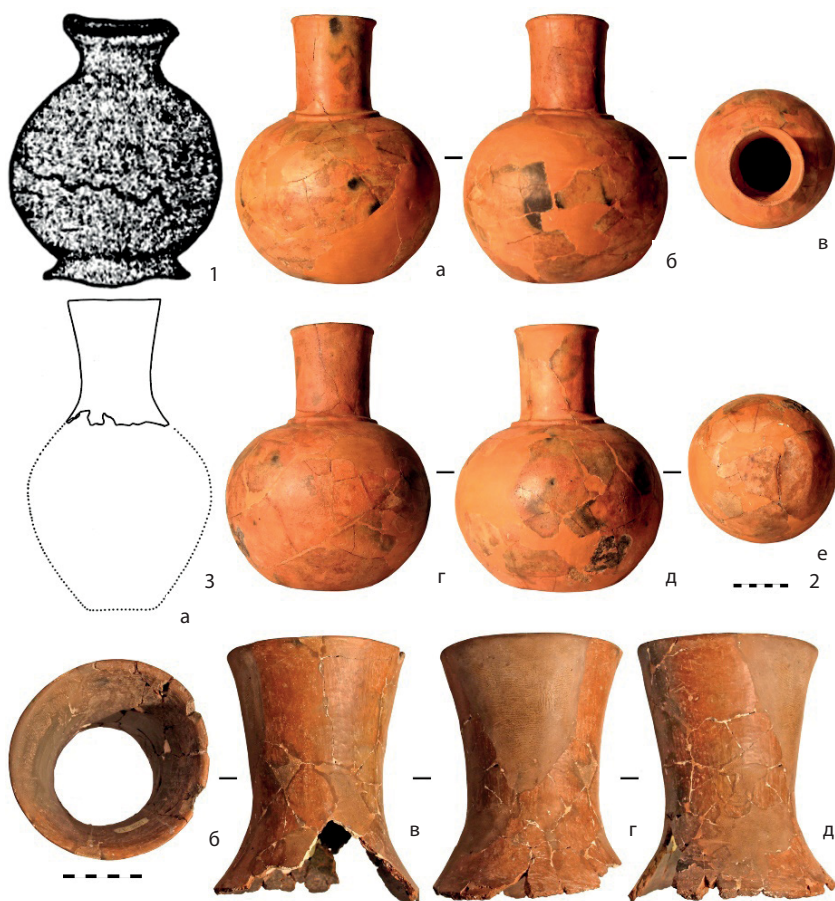
Рис. 3. Керамические сосуды из курганов пазырыкской культуры: 1 – Тышту; 2 – Шибе; 3 – Пазырык