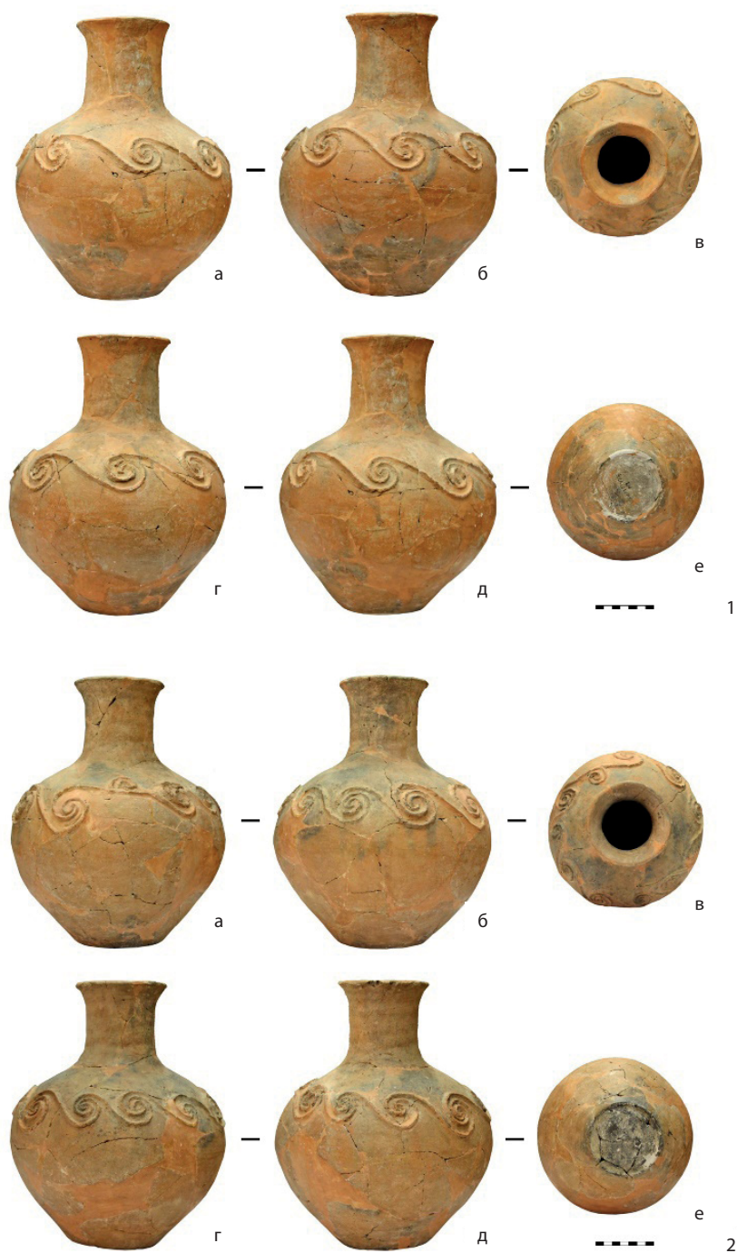
Рис. 2. Керамические сосуды из Большого Катандинского кургана