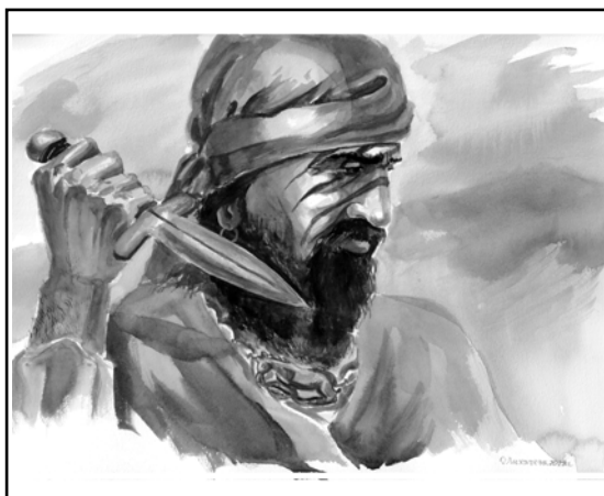
Рис. 3. Реконструкция воина «раннескифского» времени по «оленному» камню с памятника Баян булаг-1.

Чаще всего луки выбиваются изображенными в горитах с правой стороны, хотя в отдельных случаях они фиксируются слева. Они подвешены строго вертикально или наклонно, что отражает ношение/транспортировку этого вида оружия (Худяков, Эрдэнэ-Очир 2011: 56, 56). Другая серия демонстрирует лук со вложенной в тетиву стрелой (Худяков, Эрдэнэ-Очир 2011: 52—54, рис. 17: 1—7). В дан-