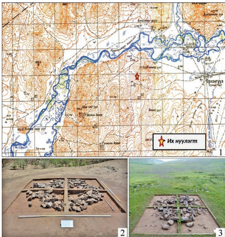
Рис. 1. Комплекс археологических памятников Их нуулэгт на фрагменте карты (1). Каменные насыпи исследованных объектов: 2 — курган №3, Их нуулэгт-III; 3 — курган №4, Их нуулэгт-I

деревянных досок. Грабители разрушили северную часть погребения. В северо-восточном углу могилы лежал частично поврежденный человеческий череп. В разных местах найдены копыта и кости ног лошади. Размеры деревянного (просевшего и частично разрушенного) перекрытия из досок такие: длина 2 м, ширина 0,8 м. После снятия перекрытия зафиксированы остатки длинного прямоугольного ящика-гроба. При зачистке обнаружен круг из бересты с отверстиями по периметру (возможно, от крышки сосуда или от другого изделия). Верхняя часть человеческого скелета оказалась сильно нарушена, а нижняя сохранилась. Судя по всему, умерший человек лежал в деревянном ящике вытянутую